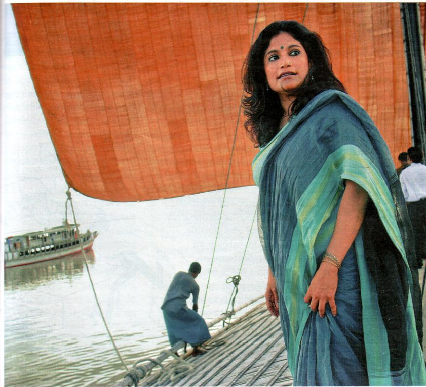
HEINE PEDERSEN/ROLEX AWARDS

1. Tél. 01 42 74 36 33 ou www.embellie.net